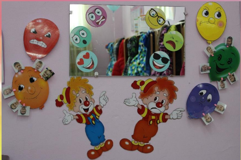
Смотр-конкурс «Уголок настроения»