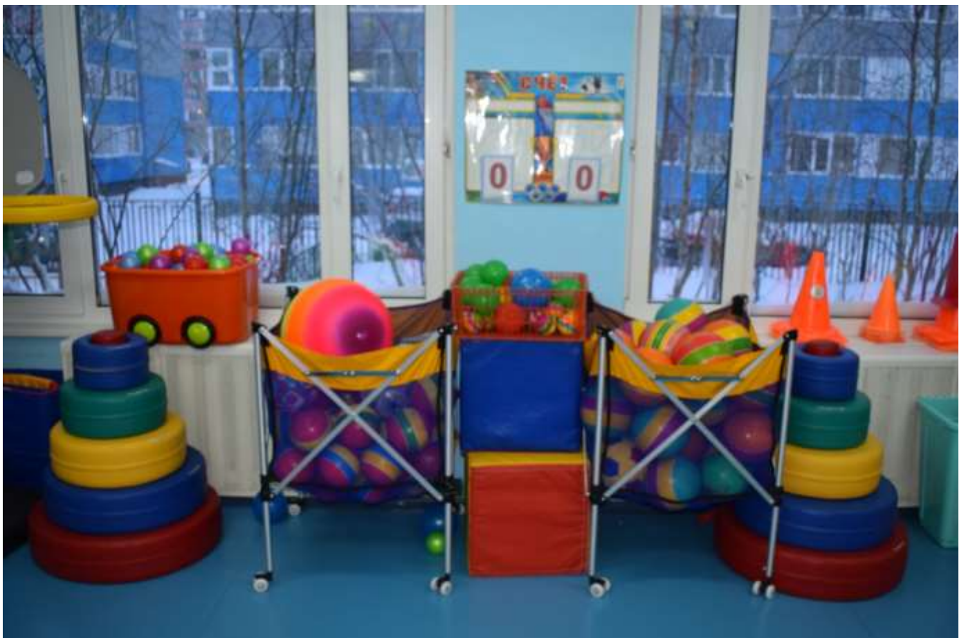
КОРЗИНЫ ДЛЯ МЯЧЕЙ